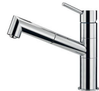
Monomando F2000 - Basso