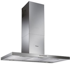
Campana extractora KS 240_002