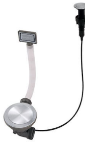
Desagüe automático Space Push - PP 8407 116