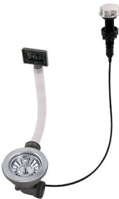
Desagüe automático 8407 100