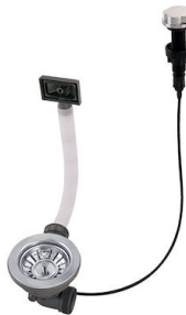
Desagüe automático 8407 000