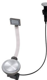
Desagüe automático Space Push - PP 8407 116