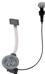
Desagüe automático Gun metal - PG 8407 110