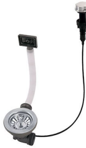
Desagüe automático 8407 100