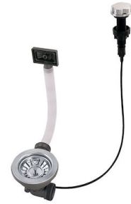
Desagüe automático 8407 000