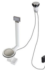
Desagüe automático Space Light - PL 8407 117