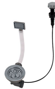
Desagüe automático Gun metal - PG