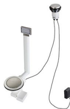
Desagüe automático Space Light - PL