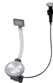
Desagüe automático Space Push - PP