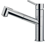
Monomando F2000 - Basso