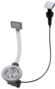
Desagüe automático 8407 113