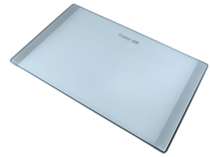
Tabla de corte de cristal 8633 300