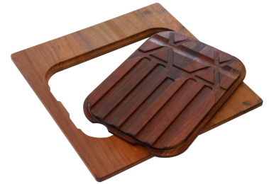
Tabla de corte Twin de madera Iroko 8644 004