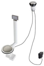
Desagüe automático Space Light