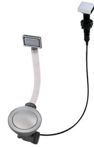
Desagüe automático Space