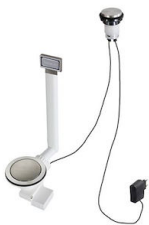
Desagüe automático Space Light