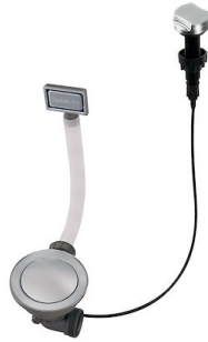
Desagüe automático Space