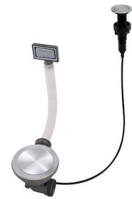
Desagüe automático Space Push