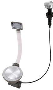
Desagüe automático Space Milano