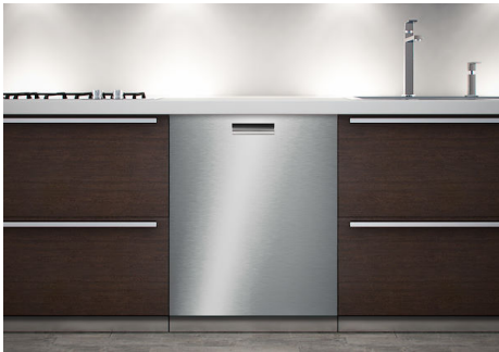
Panel de acero inoxidable