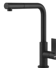
Monomando Omega Plus Matt Black 8498 626