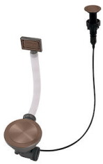
Desagüe automático Space Push Copper