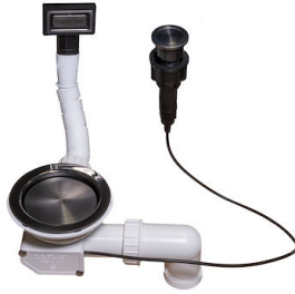
Desagüe automático Space Push Gun Metal