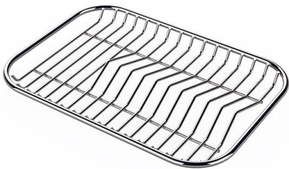
Rejilla portaplatos inox