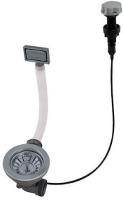
Desagüe automático Gun metal