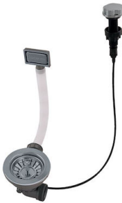
Desagüe automático Gun metal