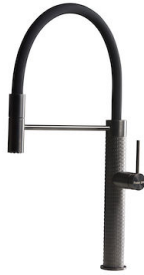
Monomando Skin Gun Metal