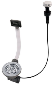
Desagüe automático 8407 000