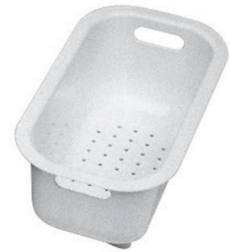
escurrir pasta blanco