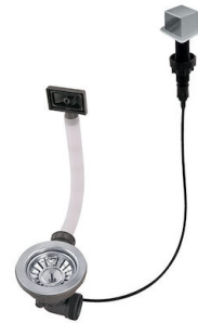
Desagüe automático LIRA