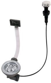
Desagüe automático 8407 000