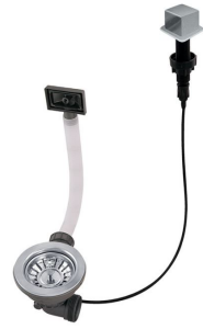
Desagüe automático LIRA 8407 103