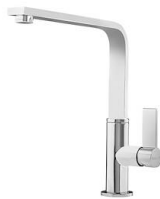
Miscelatore Gamma 3 vie - satinato 8496 100