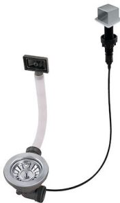
Desagüe automático LIRA