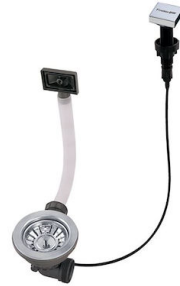
Desagüe automático LIRA