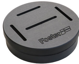
Sujetador de cuchillo