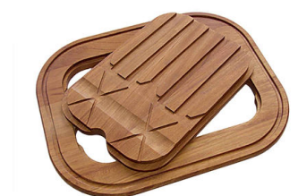
Tabla de corte Twin de madera Iroko

* sólo en combinación con el accesorio 8644 003