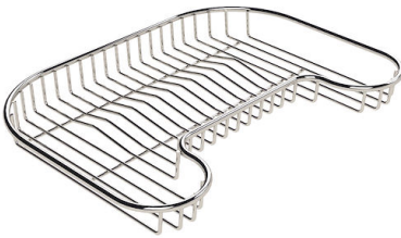
Rejilla portaplatos inox