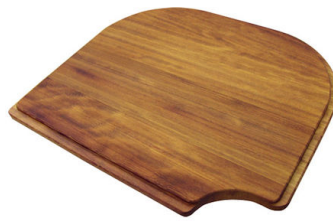
Tabla de corte de madera Iroko