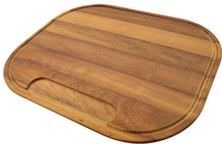
Tabla de corte de madera Iroko