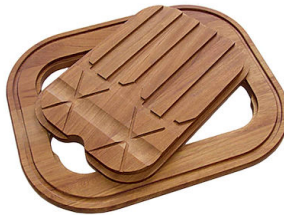
Tabla de corte Twin de madera Iroko