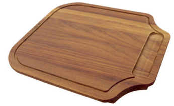
Tabla de corte de madera Iroko