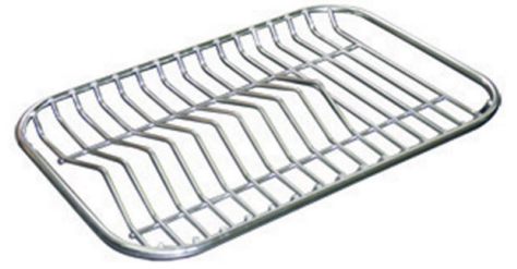
Rejilla portaplatos inox