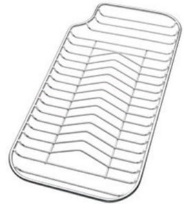
Rejilla portaplatos inox