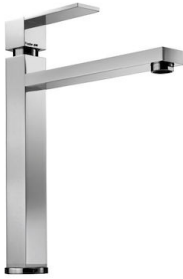
Monomando Tre Alto