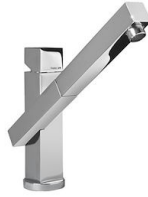
Monomando Twix Plus