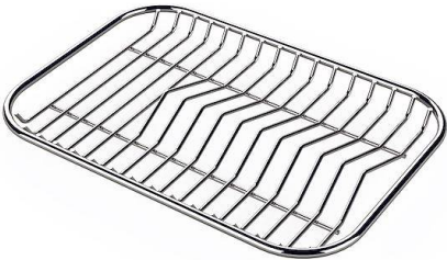
Rejilla portaplatos inox sólo se puede utilizar en combinación con los accesorios 8644 003 8100 154