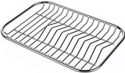
Rejilla portaplatos inox sólo se puede utilizar en combinación con los accesorios 8644 003 8100 154