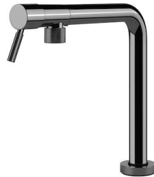
Monomando Margot Gun Metal