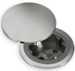
Kit copertura CIP