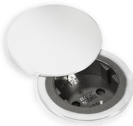
Kit copertura CIP