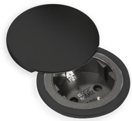
Kit copertura CIP