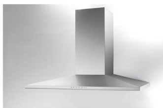
Cappa d'aspirazione Amélie