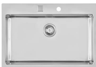
Lavello KE Filotop sopra