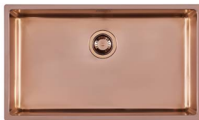
Lavello KE Copper