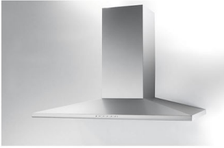
Cappa d'aspirazione Amélie