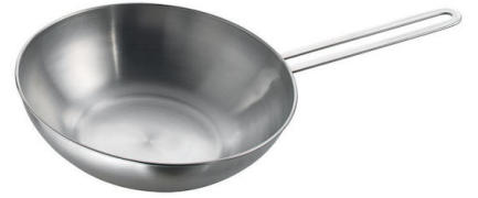
Padella wok con fondo piatto Induction PRO