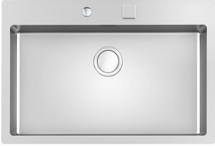
Lavello S4001 Sopratop I Filotop 3366 050