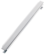
Distanziere per piani Domino 8320 000