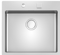
Lavello S4001 Filotop - 3365 050