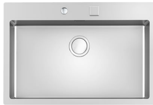
Lavello S4001 Filotop