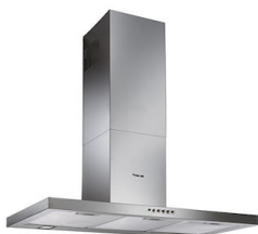
Cappa d'aspirazione KS 240_002