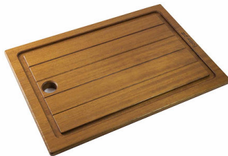
Tagliere in legno Iroko