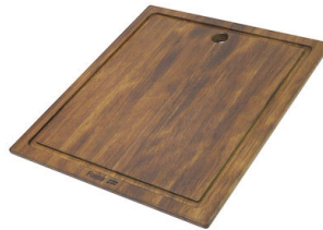
Tagliere scorrevole in legno Iroko