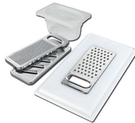
Kit grattugia con supporto per anello e vassoio di raccolta alimenti