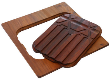
Tagliere Twin in legno Iroko