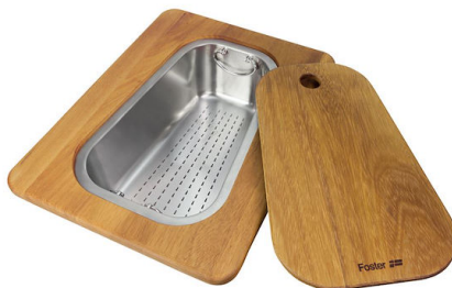
Kit tagliere in legno Iroko con vaschetta scolapasta in acciaio inox