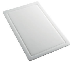
Tagliere in HPDE