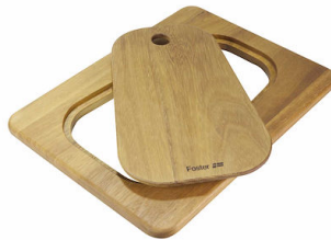
Tagliere Twin in legno Iroko