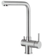
Miscelatore Gamma 3 vie - satinato