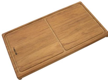
Tagliere scorrevole in legno Iroko