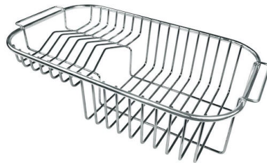
Cestello portapiatti inox