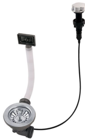
Piletta automatica 8407 100