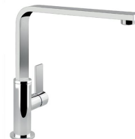
Miscelatore NYC 8486 000