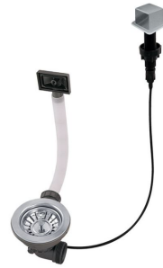
Piletta automatica LIRA 8407 103