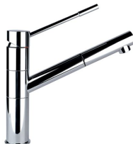
Miscelatore Lorenzo 8466 000