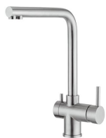
Miscelatore Gamma 3 vie 8496 100