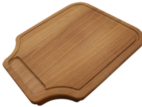
Tagliere in legno Iroko 8647 000