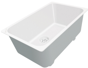
Vaschetta bianca 8153 100